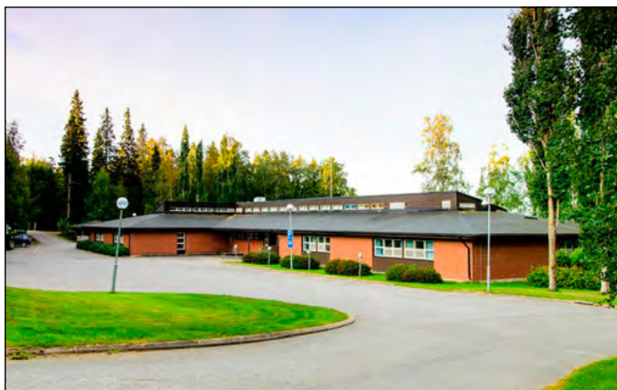
Lepikko lägergård i Alskat, Korsholm, ägs av Vasa evangelisk-lutherska församlingar och används i första hand för den finska församlingens lägerverksamhet. Den ligger vackert belägen med utsikt mot Replotbron.

Huvudföredragen på fredag och lördag hålls kl 10 och 14 med efterföljande respons och diskussion. På söndag avslutas konferensen med högmässa kl 10.