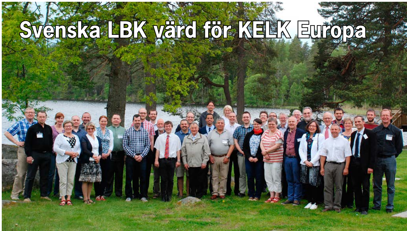
Deltagare i KELK Europas möte på Hjortsbergagården 5–7 juni 2015.

Den 5–7 juni hölls Europakonferensen för den världsvida organisationen Konfessionella Evangelisk-Lutherska Konferensen. Denna gång var den förlagd till Sverige och hölls på Hjortsbergagården i Alvesta. Den avslutande högmässan hölls tillsammans med Markusförsamlingen i Ljungby.