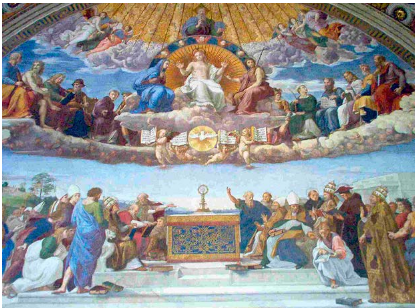
Rafaels målning "Disputa", nattvardsstriden, i Vatikanen.

c) Indirekt motstånd, som försvårar bibeltroget arbete. Det är ganska många i dag som funderar över vad man ska göra när den egna församlingen, biskopen och ärkebiskopen går emot Gud