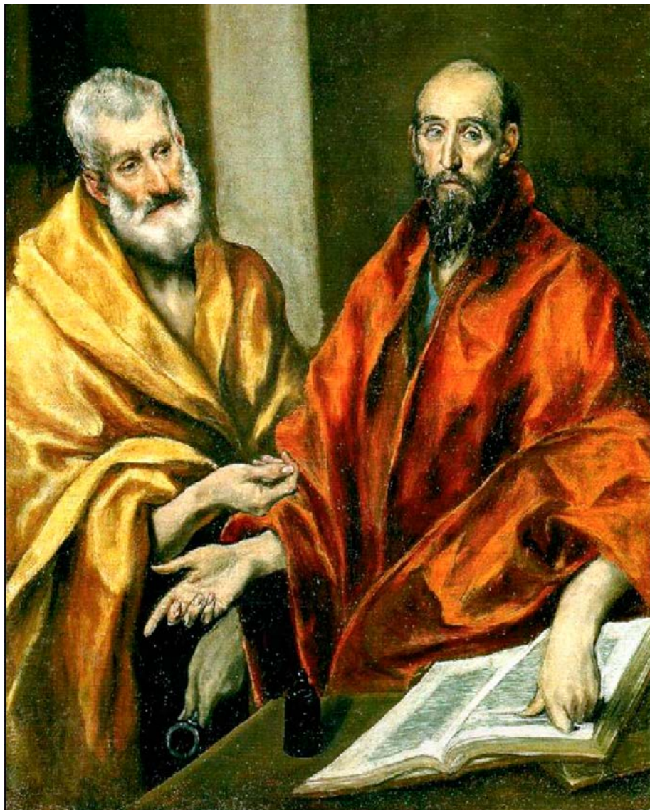
Målning av Petrus och Paulus av El Greco.

Simon, Johannes son , var till yrket en fiskare från Betsaida, men bodde i Kapernaum vid Genesarets sjö när han blev kallad till apostel. Han var gift och hade även barn enligt en tidig källa. Av Jesus fick han det arameiska tillnamnet Kefas som betyder ”sten” eller ”klippa”, på grekiska pétros. Evangelierna beskriver honom emellertid som en som tänker och talar snabbt och impulsivt, på sätt och vis en ostabil och opålitlig person. När Herren talade om att han snart skulle dö i Jerusalem tog Petrus sig för att tillrättvisa honom: ”Gud bevara dig, Herre! Det där ska aldrig hända dig” (Matt 16:22). För detta (lite