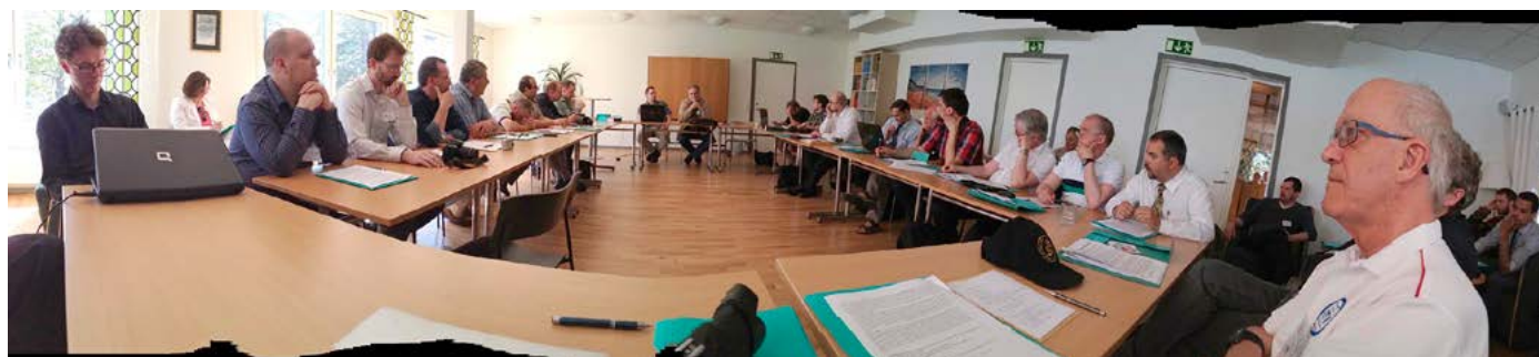
Från konferensrummet på Hjortsbergagården.

Vi har systerkyrkor i fyra afrikanska länder: Kamerun, Malawi, Nigeria och Zambia. Dessa kyrkor har tidigare deltagit i det världsvida CELC vart tredje år. Nu har denna ”Afrika-CELC” den 14–17 april i år genomfört sin andra regionalkonferens. Temat var de unga missionskyrkornas självständighet och egna ekonomiska ansvar.