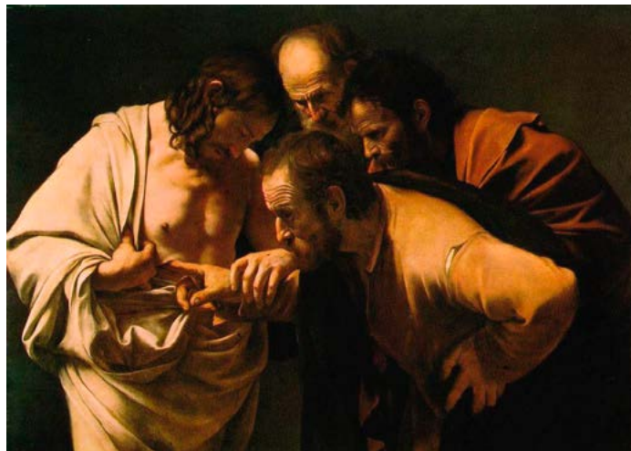
St: Tomas tvivel. Målning av Caravaggio, 1601.

Men de hade svikit Jesus. De hade alla övergett Honom och flytt. Petrus hade förnekat Honom. Ändå kunde de veta att de var förlåtna. Jesus stod mitt ibland dem och berättade det för dem. Nu stod allt väl till mellan dem och Gud. Han visade dem sina händer