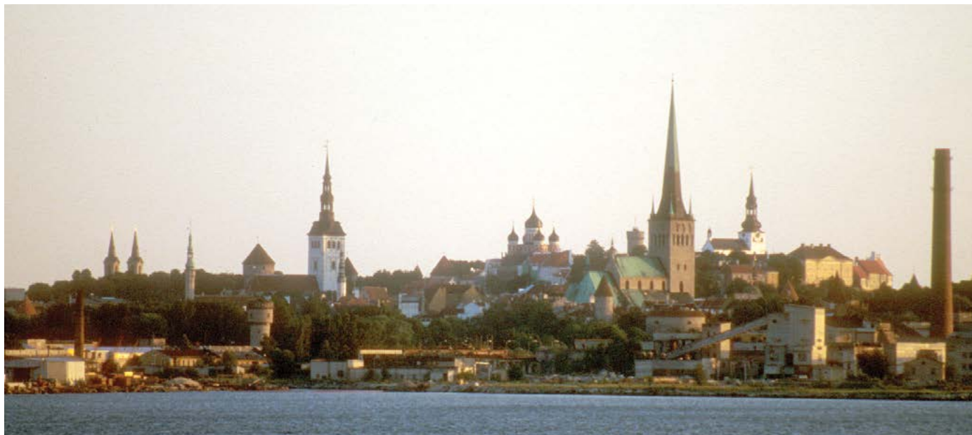
En för Estlandsresenärer känd vy över gamla Tallinn med dess många kyrktorn, som vittnar om gångna tiders andlighet.

Därför samarbetar vi i S:t Johannes församling inte med andra kyrkosamfund som lär eller tolererar falsk lära. Ändå vet vi att det finns kristna i alla sådana samfund där evangeliet fortfarande predikas. Alla som tror på Kristus är ett med oss i Kristi ena kyrka. Men, eftersom vi inte kan se in i människors hjärtan för att se om de tror så kommer vi inte att vara med i samma kyrkosamfund här på jorden, även om det är möjligt att vi är tillsammans med dem i den osynliga kyrkan.