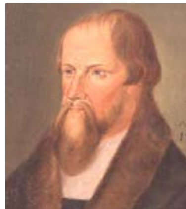
Caspar Cruciger, målat av Lucas Granach den yngre.