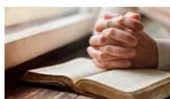
Käre Jesus! Tack för att du var trogen i din offer tjänst för mig och alla! Hjälp mig att följa dig och ära dig på din kärleks offerväg. Amen.

Om du vill stöda vår församling kan du göra det via bankgiro eller MobilePay 18161 (insamlingsställstånd i Österbotten; du kan skanna av koden nedan).