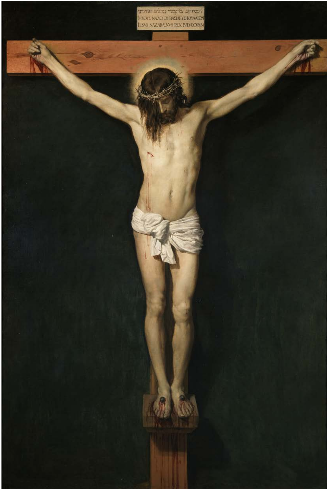
Den korsfäste Kristus, målning av Diego Velázquez (1599–1660).