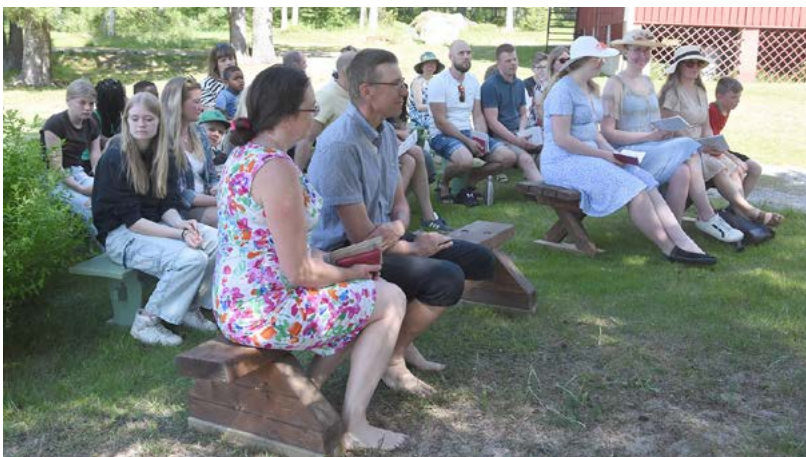
Från förra årets familjedag på Svedja.

Följande söndag, den 16 juni, hålls en familjegudstjänst kl 13 på