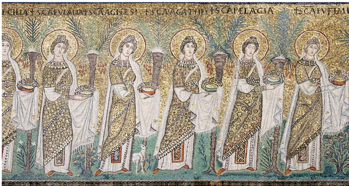
Agnes med ett vitt lamm, (nr tre från vänster), avbildat tillsammans med andra jungfrumartyrer på en väggmosaik från 500-talet i Ravenna.

Bland de mest kända martyrer från den tidiga kyrkan är Agnes av Rom. Hennes berättelse blev en inspiration för många kristna, inklusive Martin Luther som ofta hänvisade till henne.