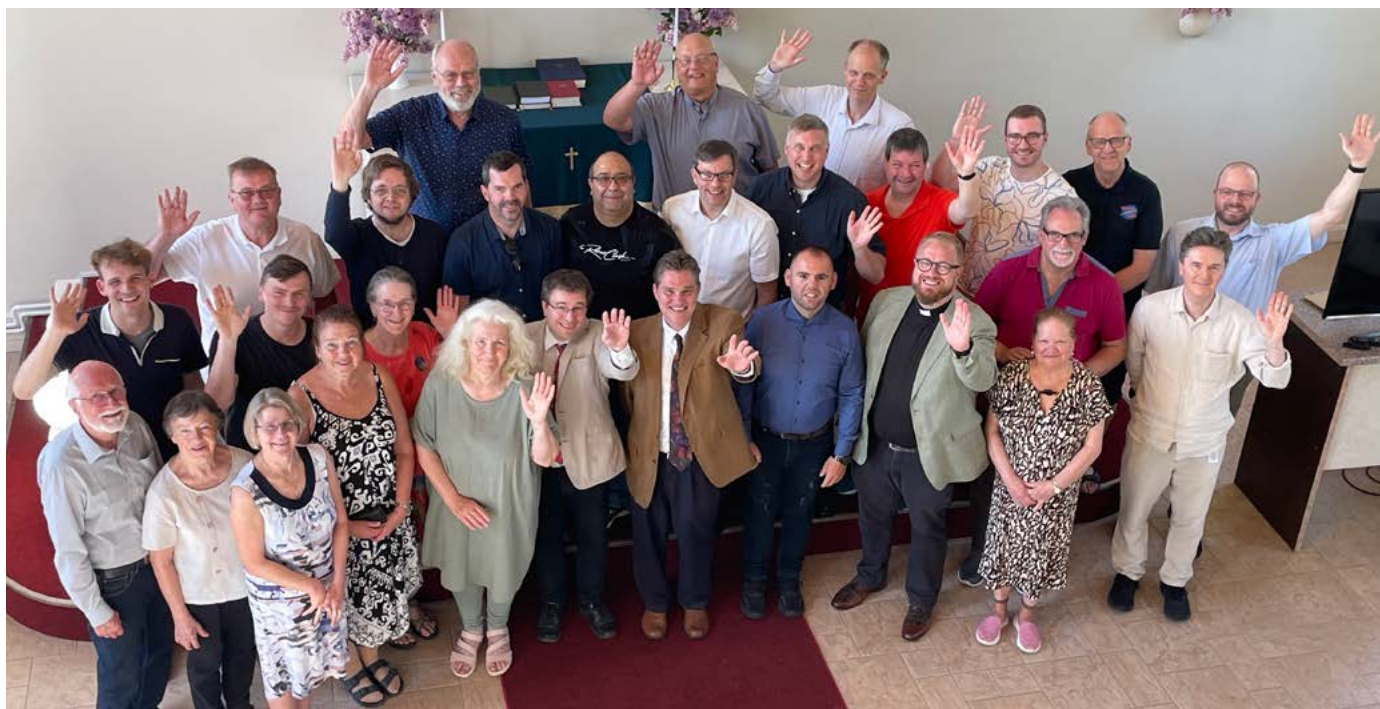
Ett glatt gäng från nio länder förenat i samma tro, lära och bekännelse